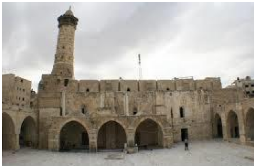
مسجد عمری در غزه که یکی از مساجد قدیمی این شهر است.

فلسطین کشوری پهناور و دارای خوبی های فراوان است. که غزه از شهرهای آن در دوره های اسلامی تحت نظارت مالی و اداری حکومت های آن دوران اداره می شد. و در منابع تاریخی مورد پیشینه تاریخی غزه می گویند که این شهر را